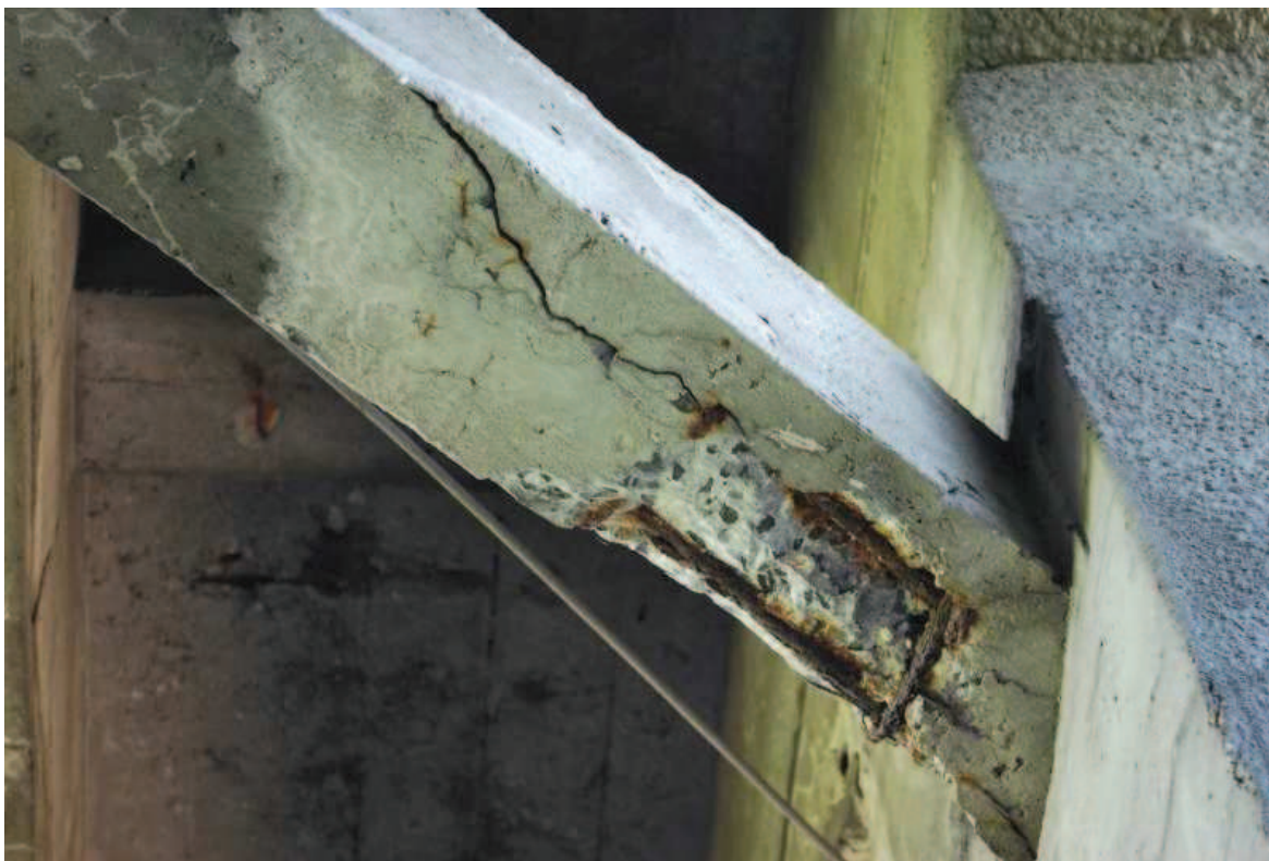
Fot. 7. Widok na poprzecznicę pomiędzy ramami nośnymi po stronie wschodniej. Widoczne rysy, ubytki i osady betonu oraz korozja stali zbrojeniowej .