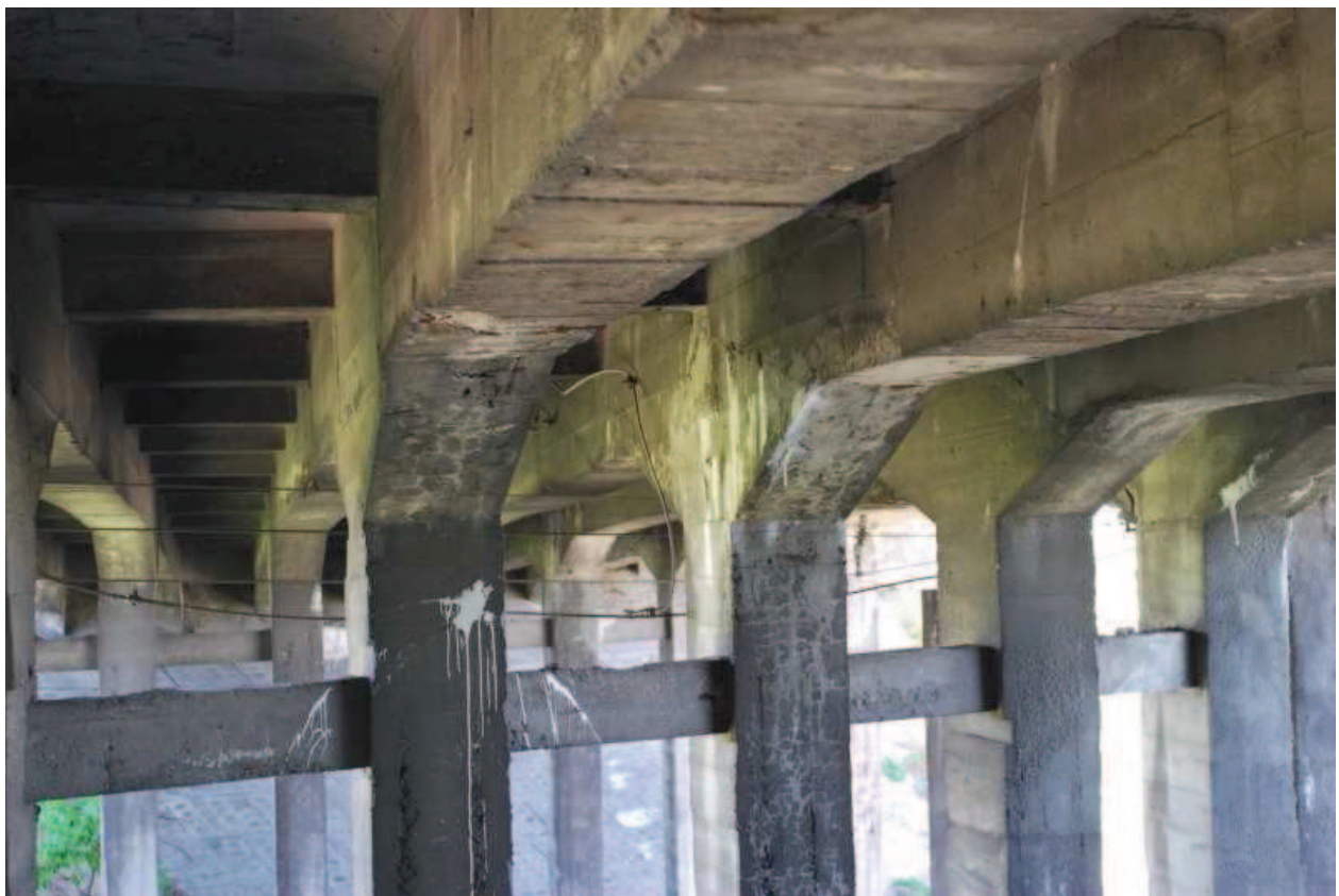
Fot. 4. Widok od spodu na konstrukcję nośną obiektu.