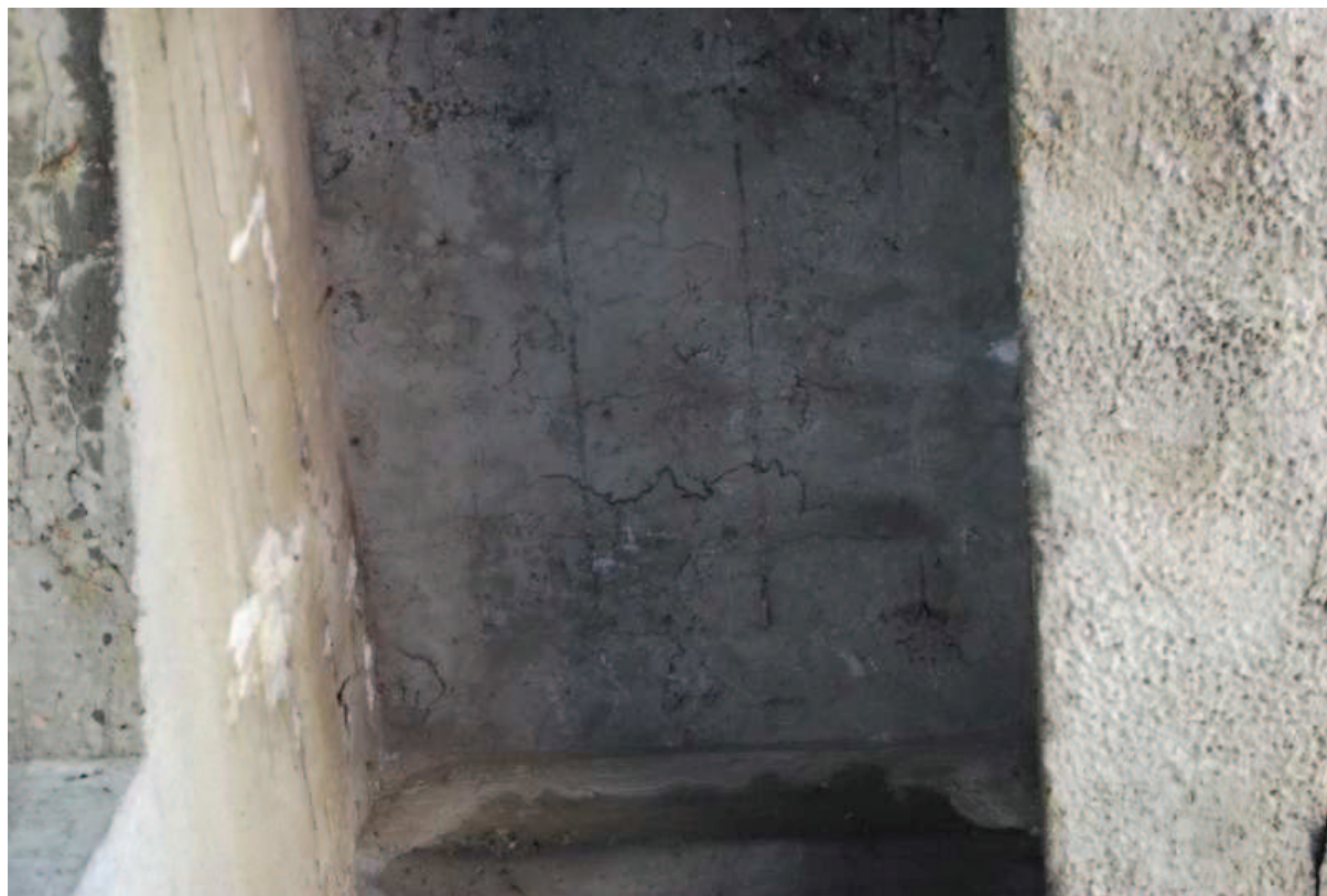
Fot. 13. Widok płyty pomostu. Widoczne rysy betonu oraz zacieki świadczące o niesprawności izolacji.