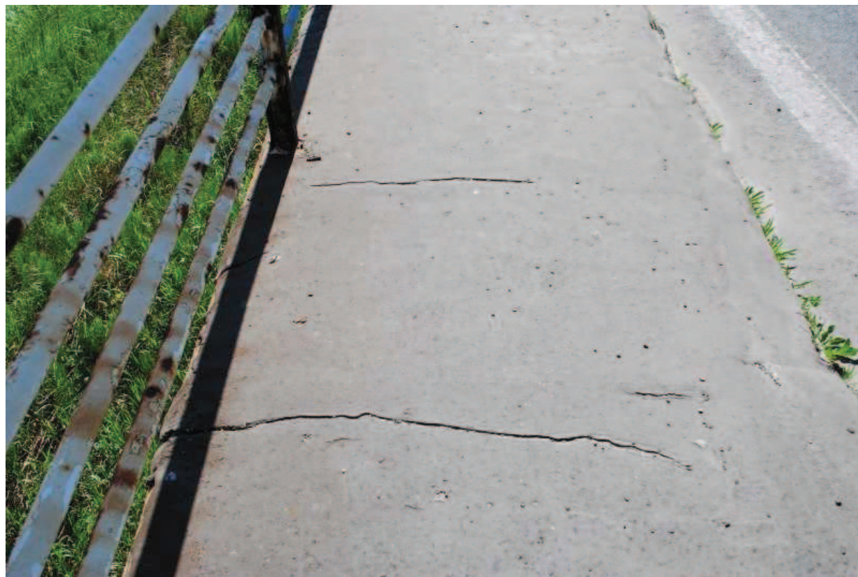
Fot. 21. Widok na nawierzchnię chodnika wschodniego. Widoczne rysy asfaltu.