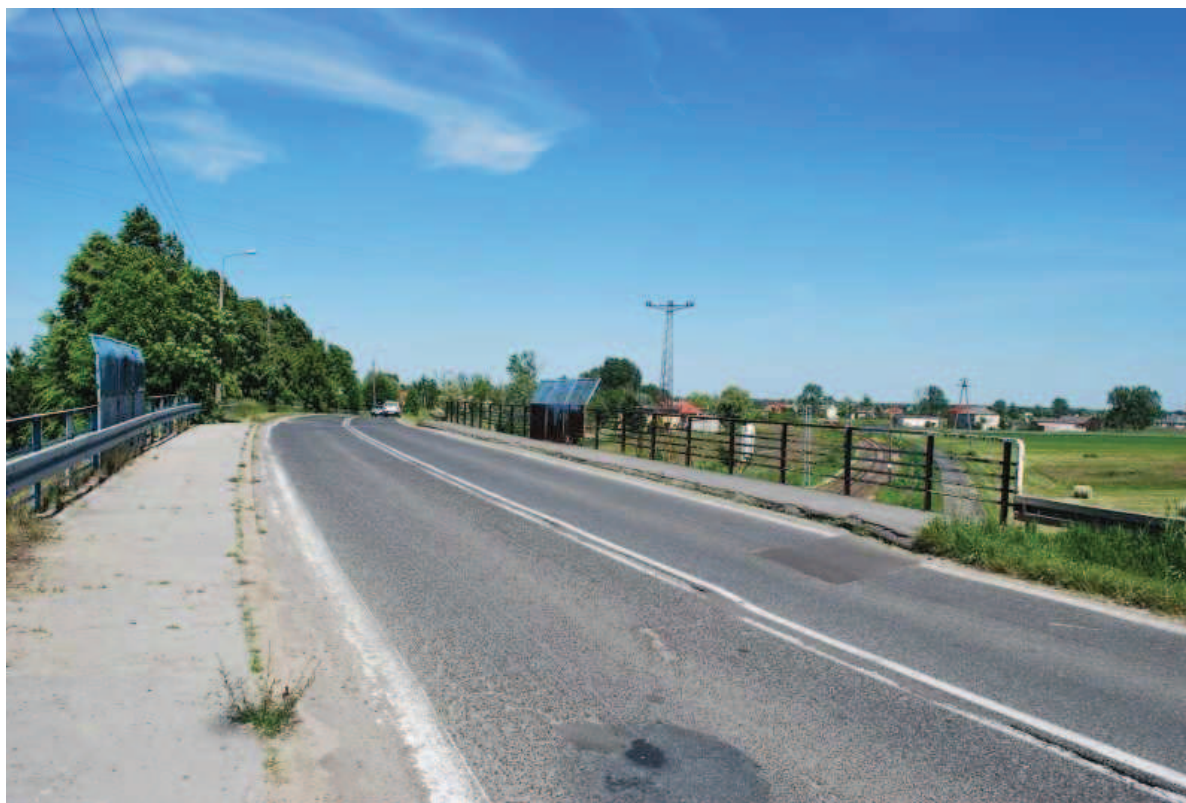
Fot. 2. Widok od strony południowej.