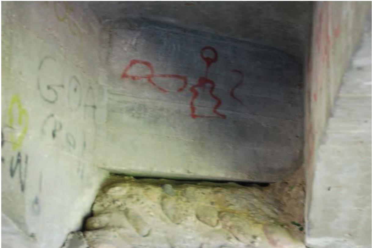
Fot. 15. Widok na poprzecnicę skrajną. Widoczne zanieczyszczenia grafitti.