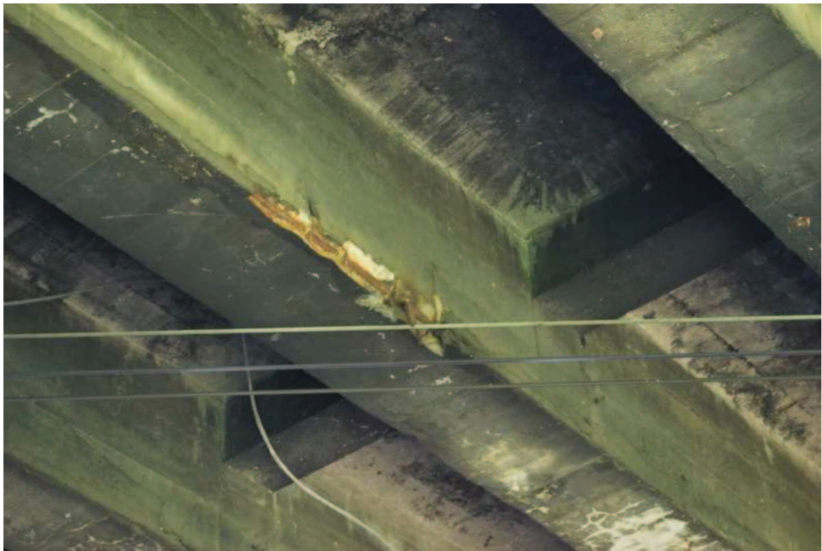
Fot. 12. Widok na belkę ramy wewnętrznej. Widoczne ubytki, rysy betonu i korozja stali zbrojeniowej belki oraz osady i zanieczyszczenia płyty pomostu.