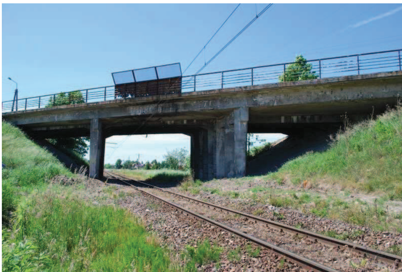
Widok ogólny mostu