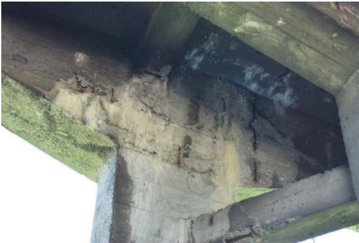
Fot. 10. Widok na górny odcinek południowej podpory pośredniej po stronie zachodniej. Widoczne rysy, ubytki betonu oraz osady i zacieki spowodowane przeciekami wody przez nieszczelną izolację pomostu.