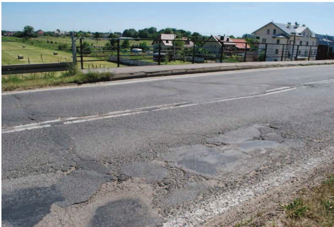
Fot. 17. Widok na nawierzchnię w strefie dylatacji północnej. Widoczne rysy, ubytki, zanieczyszczenia oraz deformacje asfaltu.