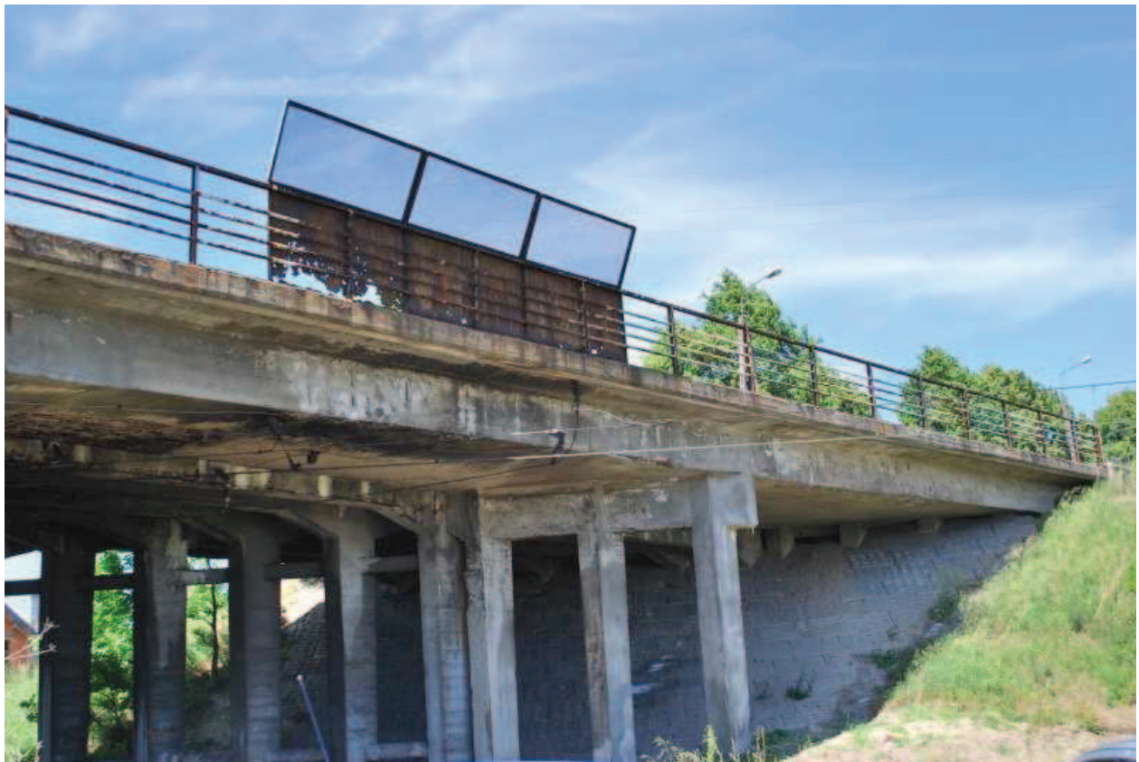
Fot. 3. Widok od strony wschodniej.