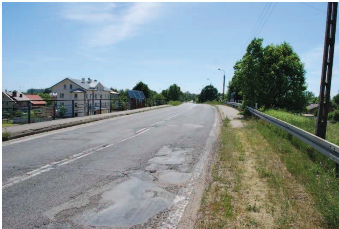
Fot. 1. Widok od strony północnej.