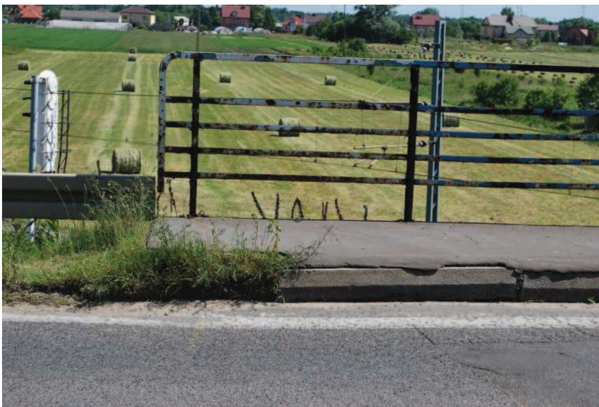
Fot. 18. Widok na chodnik wschodni od strony północnej. Widoczna wegetacja roślinności, ubytek i przemieszczenia betonu oraz ubytek nawierzchni asfaltowej chodnika. Brak prawidłowego zakończenia bariery ochronnej („baraniego rogu”) przy balustradzie.