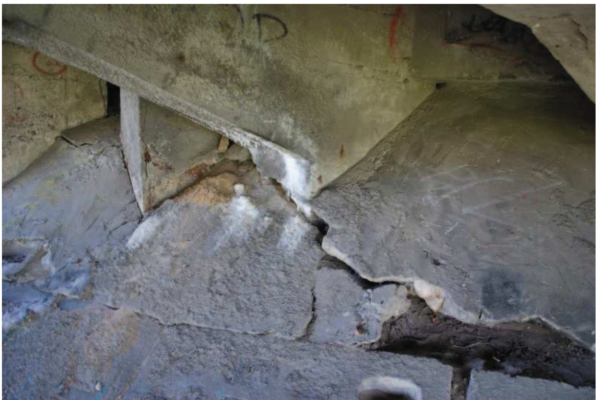
Fot. 16. Widok umocnioną skarpy zachodnią przy podporach skrajnych. Widoczne rysy, ubytki i przemieszczenia betonu spowodowane prawdopodobnie przemieszczeniem grunt.