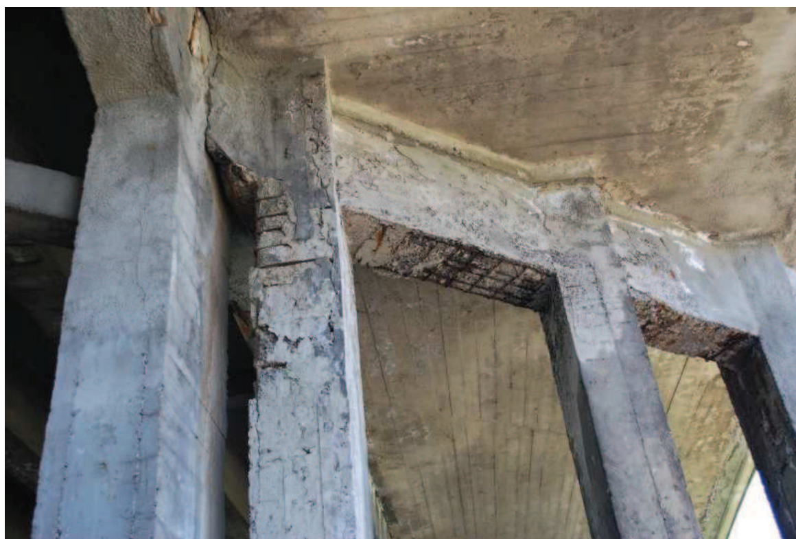
Fot. 8. Widok na południową podporę pośrednią konstrukcji od strony wschodniej. Widoczna korozja, ubytki, rysy i osady betonu oraz korozja stali zbrojeniowej spowodowane prawdopodobnie przeciekami wody przez nieszczelną izolację pomostu.