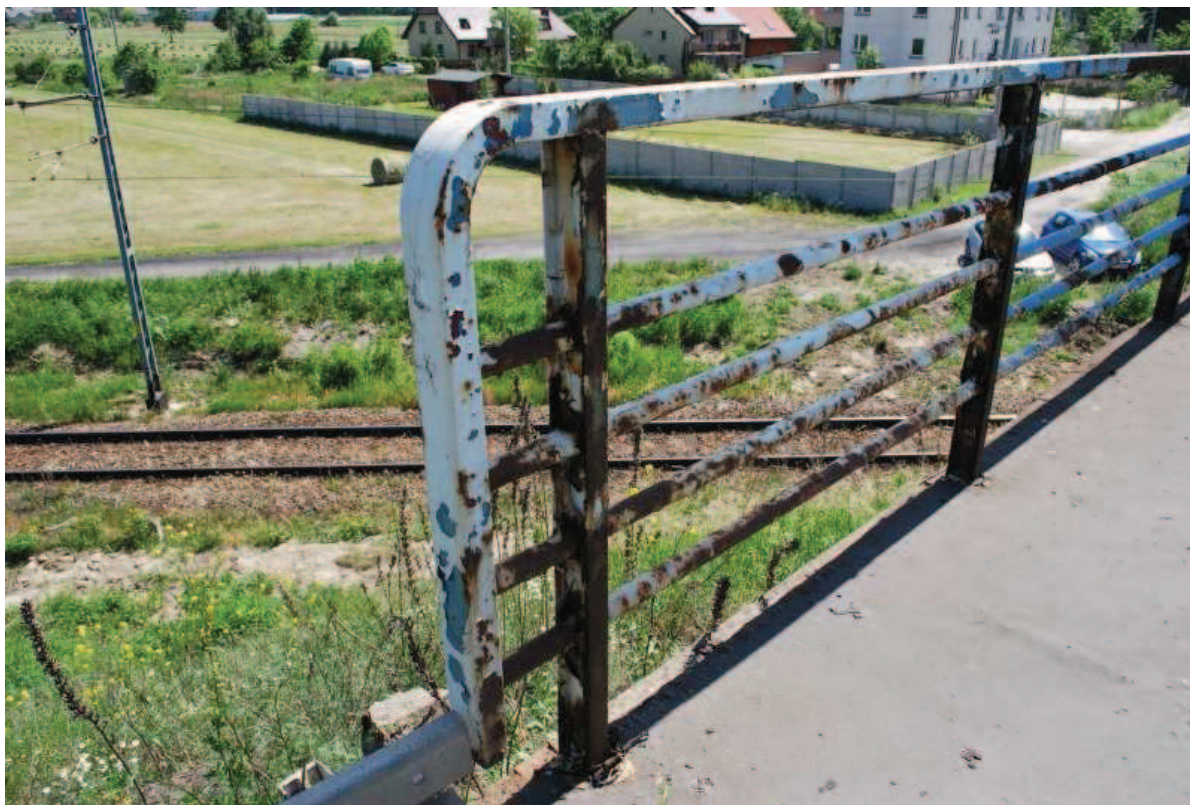
Fot. 19. Widok na balustradę wschodnią po stronie północnej. Widoczna intensywna korozja stali oraz ubytek zabezpieczenia antykorozyjnego elementów balustrady