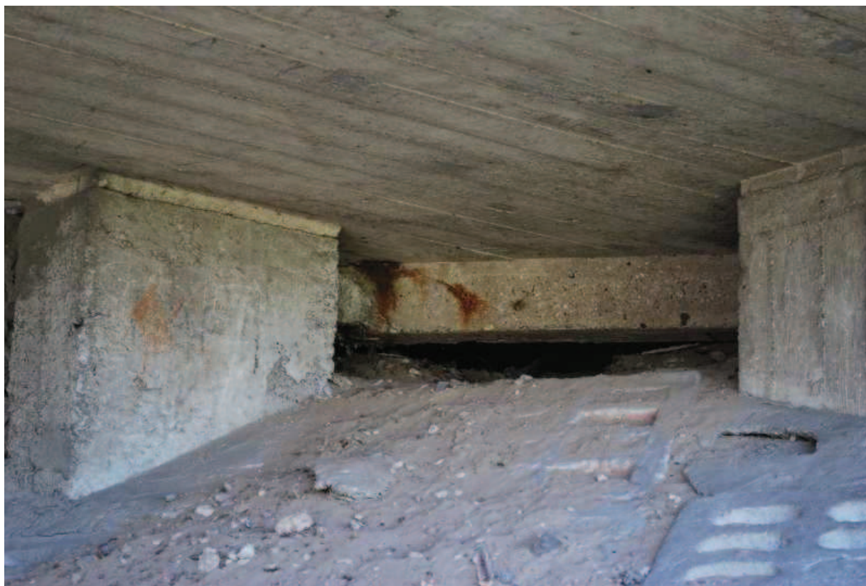
Fot. 14. Widok na umocnioną skarpe podpory skrajnej. Widoczne ubytki terenu oraz przemieszczenia i zanieczyszczenia betonu.