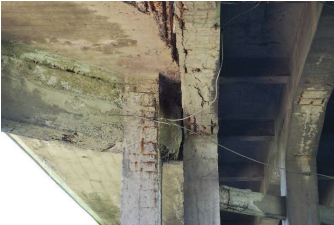
Fot. 9. Widok na północną podporę pośrednią konstrukcji od strony wschodniej. Widoczna korozja, ubytki, rysy i osady betonu oraz korozja stali zbrojeniowej spowodowane prawdopodobnie przeciekami wody przez nieszczelną izolację pomostu.