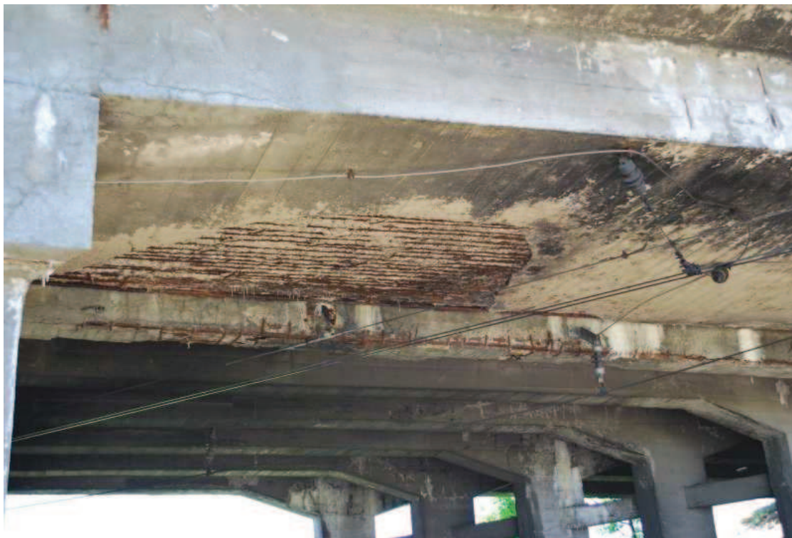
Fot. 5. Widok na konstrukcję nośną obiektu od strony wschodniej. Widoczna korozja, ubytki i zanieczyszczenia betonu oraz korozja stali zbrojeniowej. Zacieki i osady wskazują na brak skuteczności izolacji pomostu.