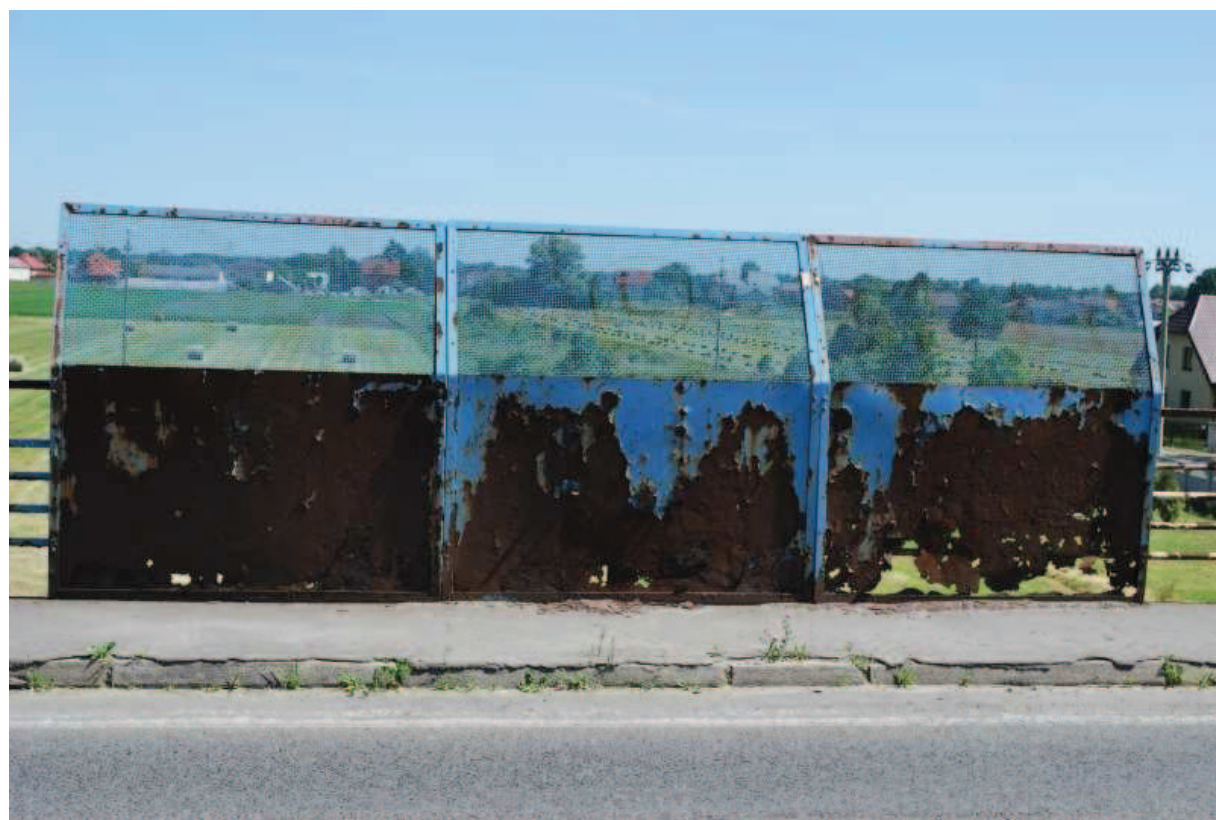
Fot. 24. Widok ekrany przeciwporażeniowe po stronie wschodniej. Widoczne zniszczenie struktury materiału na dolnych panelach. Uszkodzenie zagraża pieszym – niebezpieczeństwo porażeniem prądem.