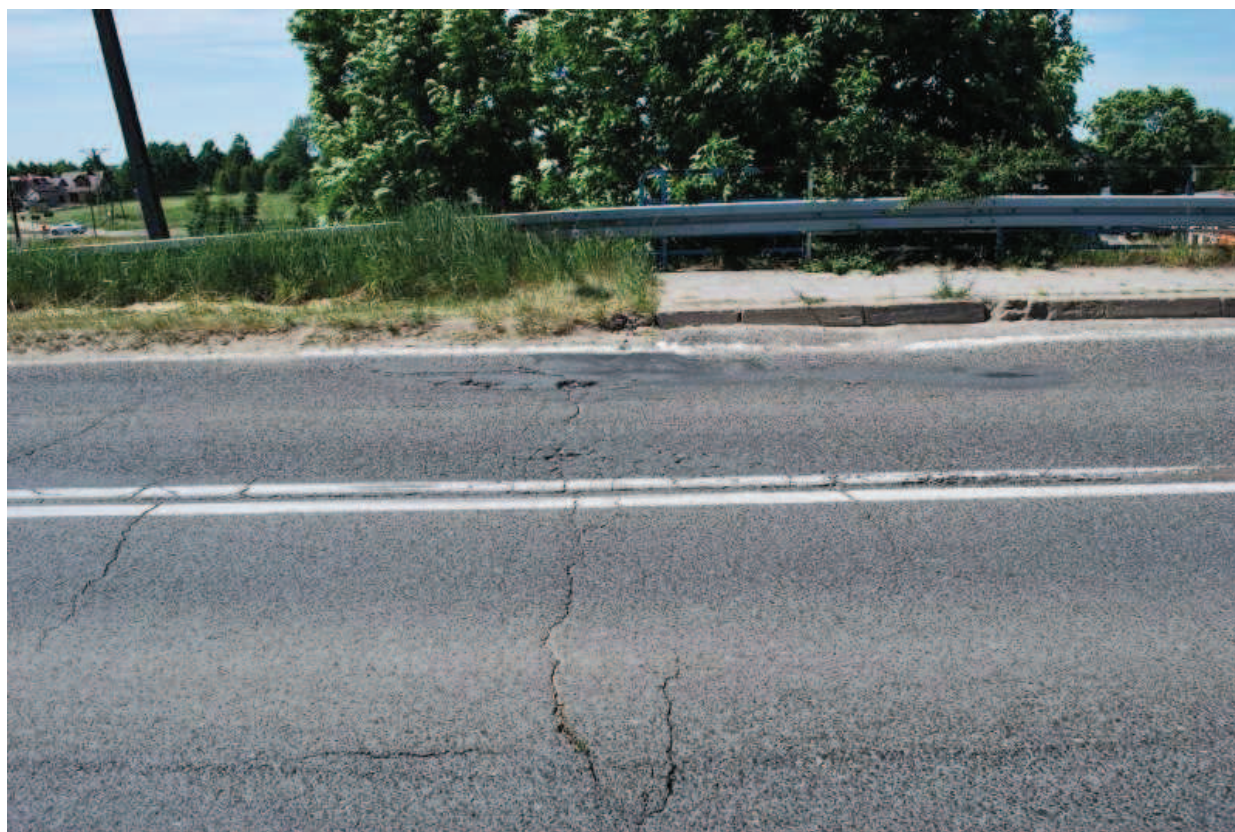
Fot. 22. Widok strefę dylatacji południowej. Widoczne rysy i ubytki w nawierzchni asfaltowej.