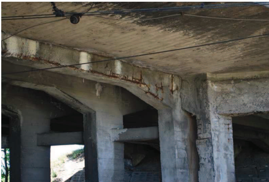
Fot. 6. Widok na zewnętrzną ramę nośną od strony wschodniej. Widoczna korozja, ubytki i zanieczyszczenia betonu oraz korozja stali zbrojeniowej. Zacieki i osady wskazują na brak skuteczności izolacji pomostu.