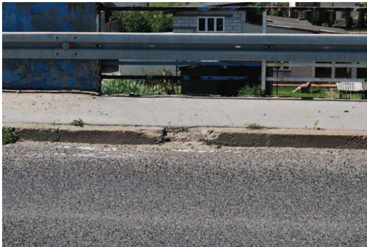
Fot. 23. Widok na krawężnik kapy zachodniej. Widoczne ubytki oraz wegetacja betonu.