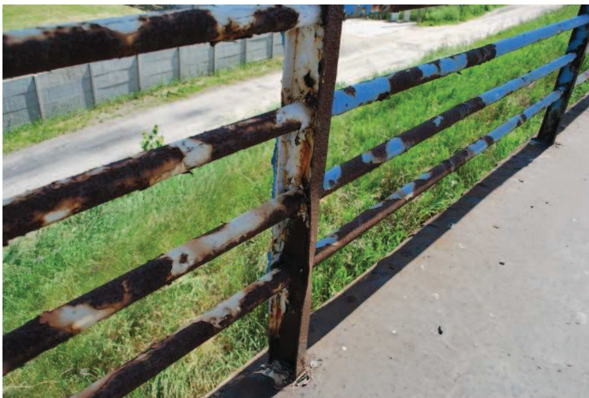
Fot. 20. Widok na słupkę balustrady wschodniej. Widoczne deformacja oraz intensywna korozja stali.