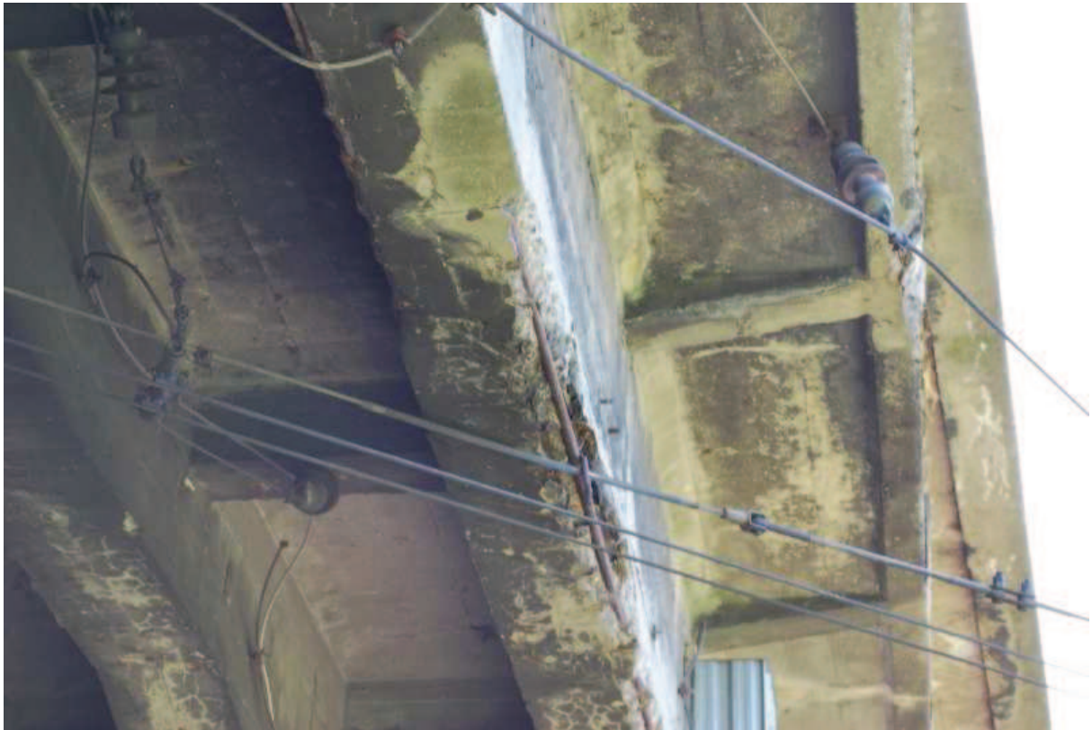
Fot. 11. Widok na belkę ramy zewnętrznej po stronie zachodniej. Widoczne ubytki, rysy, osady i zanieczyszczenia betonu oraz korozja stali zbrojeniowej.